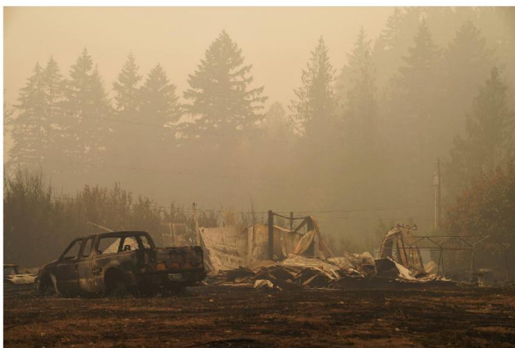
Автомобили на трассе 22, округ Марион, штат Орегон 16 сентября 2020 г.

Чтобы связаться с профильной группой защиты интересов, позвоните по номеру 888-877-4894 (бесплатно) или посетите сайт dfr.oregon.gov/help .